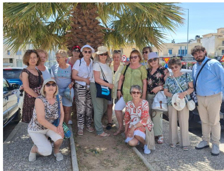
Grupa do zadań specjalnych

Nasze wrażenia z udziału w projekcie przekonują innych, mało w siebie wierzących do angażowania się w proponowane przez ŚUTW programy czy projekty.