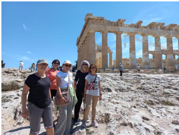
Na Akropolu w upale i po pokonaniu wzniesienia

To było bardzo atrakcyjne zadanie. Grecja jest piękna, przyjazna, a jej wkład w rozwój kultury i demokracji europejskiej jest niezaprzeczalny. Grecja zachwycała nas pięknem i zdumiewała liczbą zachowanych zabytków i sposobem ich traktowania jako skarbu narodowego.