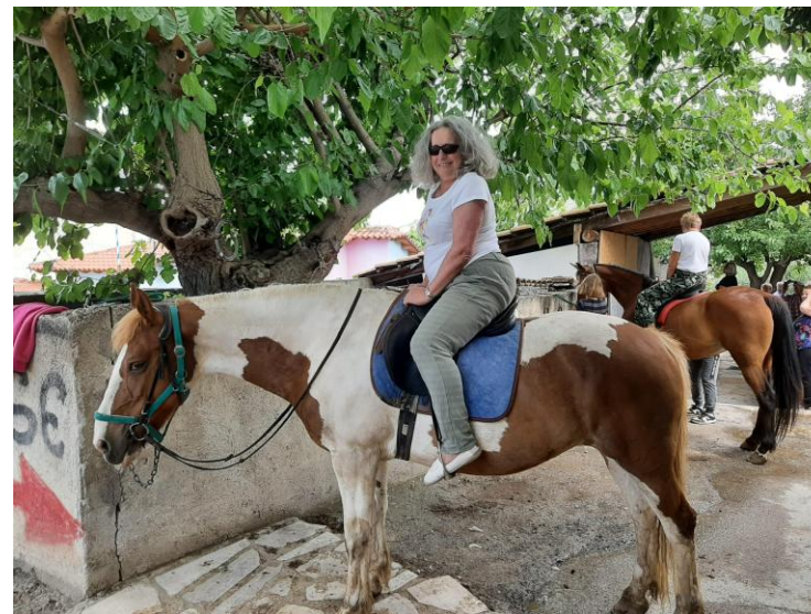
Żadne wyzwania nie stanowiły dla nas problemu

Dzięki udziałowi w projekcie, który łączył się z wyjazdem do miejscowości wypoczynkowej – po prostu wypoczęłyśmy. Miałyśmy możliwość odświeżyć własne umysły, uwolnić napięcia, więc odprężyłyśmy się psychicznie. Przy okazji poznałyśmy też możliwości własnej sprawności fizycznej, bo rzadko od siebie tyle wymagamy. Długie spacery brzegiem morza, wycieczki i wyprawy, w trakcie których pokonywałyśmy po kilka kilometrów, często po górkach i po schodach wybitnie poprawiły naszą kondycję!