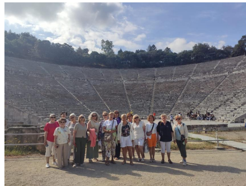
W Epidauros na scenie słynnego amfiteatru

Dzięki wycieczkom przypomniłyśmy sobie historię starożytnej Grecji, ale także poznałyśmy historie jej walk wyzwolńczych spod tureckiej niewoli.