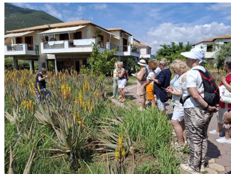
Na plantacji aloesu – niesamowite okazy

Grecja, która kojarzy nam się głównie z pięknymi wybrzeżami, to bardzo górzysty kraj. Skaliste góry porośnięte kolczastymi zaroślami niezdadne są do upraw i turystyki. Gdy któraś z nas spytała Greczynkę, jak nazywają się góry wokół Tolo, dostała odpowiedź, że nie mają nazw, bo tyle ich jest... Klimat i upór Greków czyni z tego nieprzychylnego terenu krainę zielonych upraw. Ciągłe mijaliśmy gaje oliwne, winnice, sady z dojrzewającymi cytrusami.