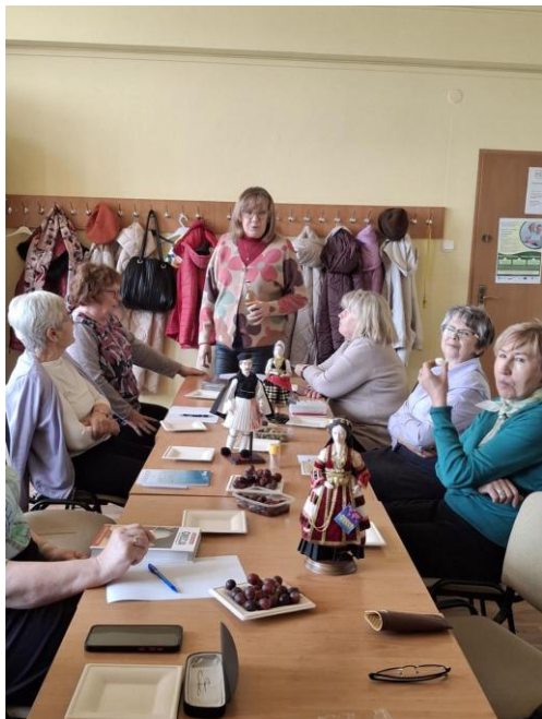
Zajęcia dotyczące kultury, historii i obyczajowości Grecji

W tym przygotowaniu wcale nie chodzi o to, że się spakowałyśmy i sprawdziłyśmy dokumenty. Do grupowej mobilności w Grecji zaczęłyśmy się przygotowywać kilka tygodni wcześniej zgodnie z wymogami programu Erasmus +.