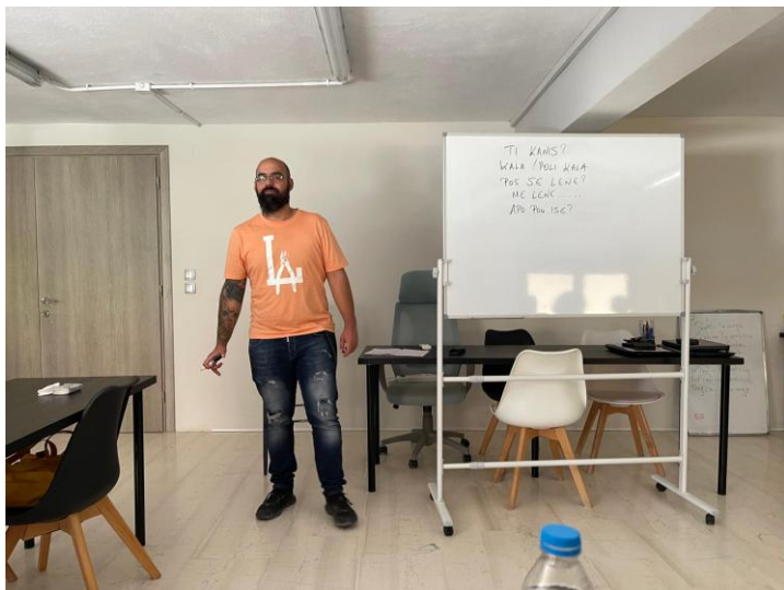
Zajęcia z języka greckiego prowadzone po angielsku, czyli dwa języki obce równocześnie

Postugiwaliśmy się językiem angielskim nie tylko w ramach zajęć, ale też w codziennej komunikacji – z obsługą hotelu, sklepach, punktach gastronomicznych itp.