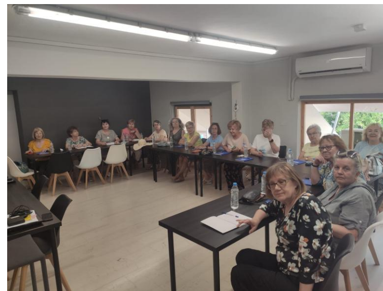
Na zajęciach teoretycznych w siedzibie White Blue

Uczęszczałyśmy na zajęcia do siedziby firmy White Blue, gdzie wykwalifikowani specjaliści prowadzili dla nas szkolenie w formie wykładów, prezentacji czy zajęć warsztatowych. Zaczęłyśmy od psychologii. Poznałyśmy – stosowany do dziś a zapoczątkowany przez Hipokratesa – podział ludzi według czterech typów osobowości. Przeszłyśmy też testy, które pomogły określić, jakim typem osobowości jest każda z nas. Przy okazji okazało się, że mamy świetnie dobrany Zarząd, bo znalazły się w nim osoby o pożądanym cechach przywódczych.