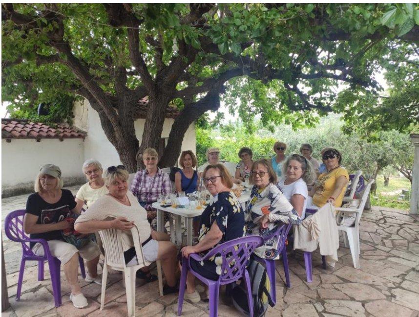
W sielskiej atmosferze greckiej wsi

Ciekawość budziły w nas rośliny nieznane w naszym klimacie, na temat których starałyśmy się zdobyć informacje. Przy okazji mogłyśmy docenić panującą w Grecji dbałość o ekologię.