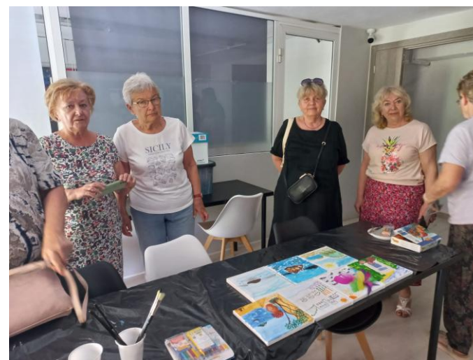
Podziwiamy nasze dzieła

W pewnej fazie szkolenia zostałyśmy podzielone na dwie grupy według typów osobowości, bo w zespole każdy typ odgrywa swoją rolę i każdy jest wartościowy. Przywódczyniami grup były nasza Pani Prezes i Pani Wiceprezes.