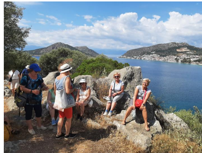
Robiąc zdjęcia, dbałyśmy też o piękne tło

Umiejętności posługiwania się komputerem czy też korzystanie z wszelkich możliwości smartfona były w naszej grupie na różnych poziomach. Tymczasem program Erasmus+ zakładał głównie komunikację cyfrową – rejestracja, zawiadomienia, ankiety... Poradziłyśmy sobie doskonale. Dzieliliśmy się własną wiedzą, spostrzeżeniami i umiejętnościami. Niektóre z nas w zakresie takiej mobilności nabrało nowych umiejętności.