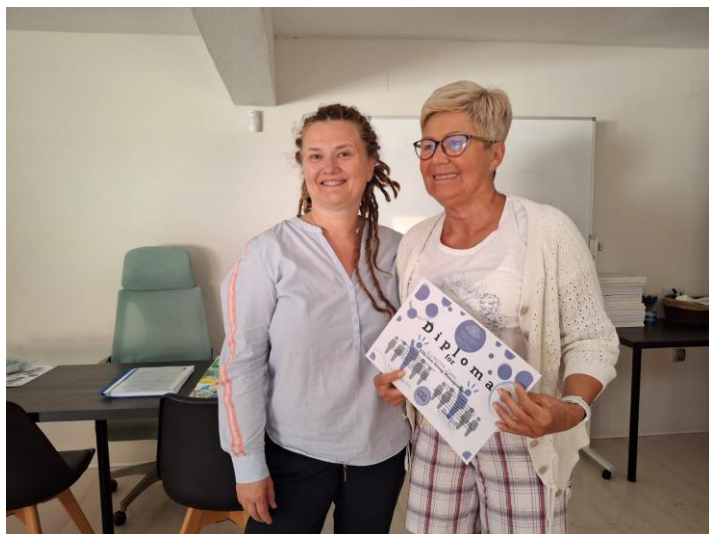
Kurs ukończył się wręczeniem dyplomów

Stosowanie motywowania i dbanie o właściwą atmosferę jest ważne dla funkcjonowania każdej grupy społecznej, czyli także naszego Uniwersytetu. Ważne jest, by wszyscy czuli się potrzebni, doceniani i zaangażowani. Służy temu uzmysłowienie sobie hierarchii ludzkich potrzeb, rozbudzenie empatii, przeciwdziałanie wykluczeniu, uczenie tolerancji.